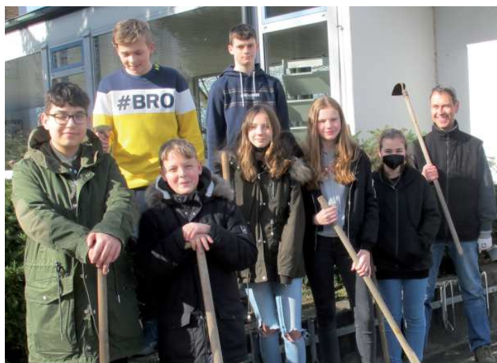
Konfis am Werk: Mit Hacke, Spaten und viel Spaß.

Kirchturm und Foyer der Johanneskirche verwertet. Es wird nicht mehr über die Kanalisation abgeleitet. Es soll sich stattdessen in Mulden sammeln und dort versickern. Diese Mulden legen die Konfis fachkundig beraten an. Das tut den Bäumen rings um die Kirche gut. Vielleicht bringt es auch dem Grundwasser ein wenig Zulauf. Und mal sehen, was diesem und den nächsten Jahrgängen sonst noch ein-