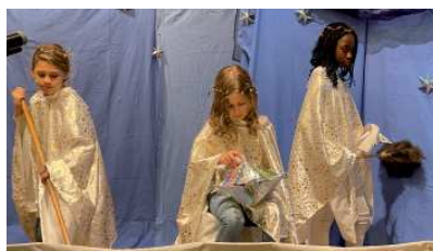
Geschenk des Himmels: Auf DVD festgehalten.

Wir hätten es uns anders gewünscht: Hoch motiviert proben Jungscharkinder, Juniorleiter und Leiter für die Aufführung unseres Weihnachtsmusicals „Geschenk des Himmels“.