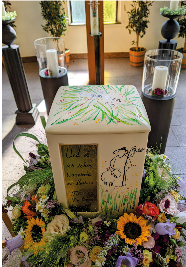
Geliebt: Die Liebe höret nimmer auf: 1. Kor 13,8.

Wir werden beim Herrn sein allezeit. So tröstet euch mit diesen Worten untereinander (1. Brief an die Thessalonicher 4,17).