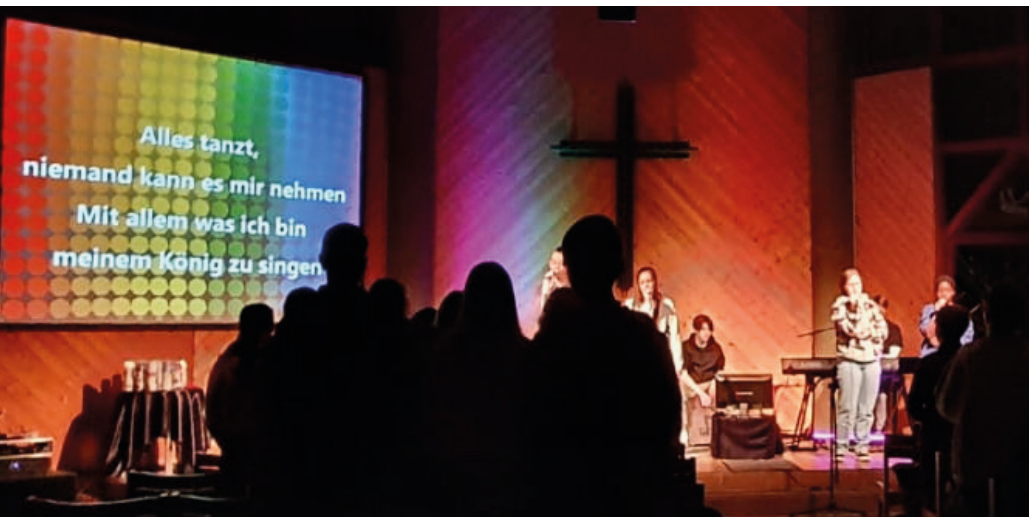
Abbah!-Team und -Band: Songs von YADA Worship.