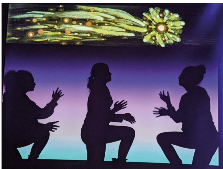
Von den Konfis gestaltet: Schattenspiel „Himmelskönig“ an Weihnachten.

SCHOKO startet ab dem 17. Mai immer mittwochs um 16 Uhr. Die dann Konfirmierten können sich schulen lassen, um als Betreuer-Team für die neuen Konfis und auf Sommer wie Herbst-Freizeit als Lehrlinge zu starten. ab